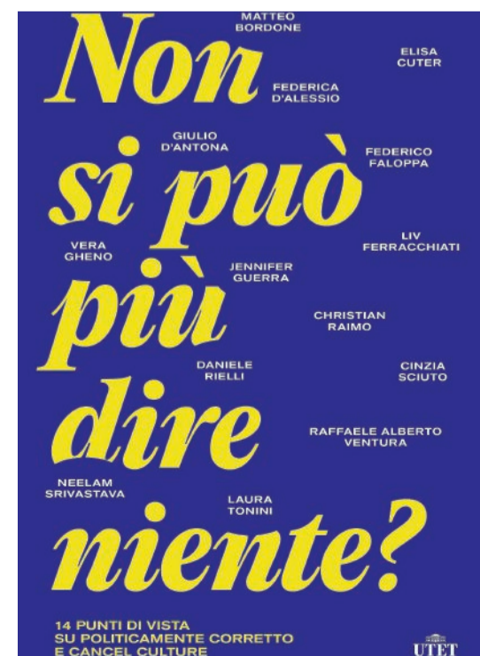
14 punti di vista